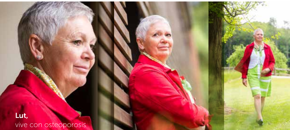
Lut, vive con osteoporosis

El 81 % de los compañeros dice sentirse orgulloso de trabajar para UCB